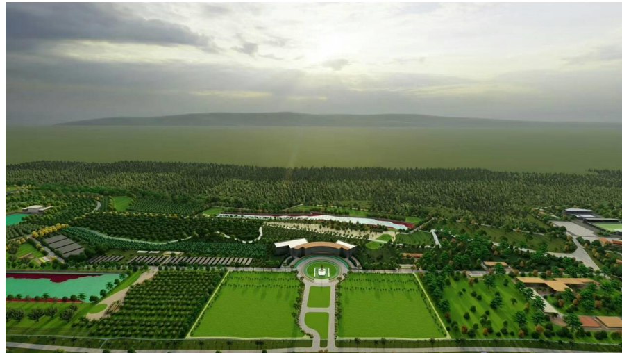
พื้นที่ดำเนินการ: มหาวิทยาลัยแม่โจ้-ชุมพร และจังหวัดชุมพร

ที่สำคัญจะเป็นสถานที่สร้างงาน และพัฒนาคนที่เป็นสิ่งสำคัญของประเทศชาติในหลากหลายมิติ ได้แก่ชุมชนท้องถิ่นที่ได้รับการถ่ายทอดงานทางด้านวิชาการ เช่นเรื่องของเกษตรอินทรีย์ที่มีเป้าหมายให้ทั้งจังหวัดชุมพรเป็นเกษตรอินทรีย์ การเพิ่มมูลค่าจากสินค้าเกษตรเป็นการเกษตรแบบสารสกัด การแปรรูปที่เพิ่มมูลค่าในตัวเอง การสร้างมาตรฐานของงานให้เป็นระดับโลก ฝึกอบรมในทุกช่วงอายุ-วัย เป็นแหล่งเรียนรู้ของทุกคน ที่เป็นของคนชุมพร เป็นของประเทศไทย ทั้งนี้มีพื้นฐานมาจากการสร้างเมืองชุมพรให้เป็นเมืองแรกรับสำหรับการท่องเที่ยวที่มั่นคงของภาคใต้ เป็นการเชื่อมต่อทิศทางการท่องเที่ยวลงไปยังจังหวัดสุราษฎร์ธานีต่อไป