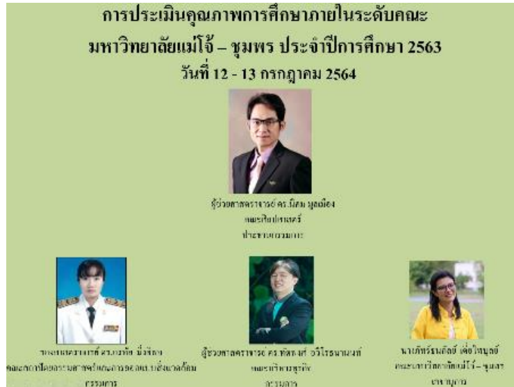
ประธานกล่าวต้อนรับและแนะนำคณะกรรมการตรวจประเมิน