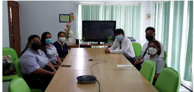
การสัมภาษณ์นักศึกษา