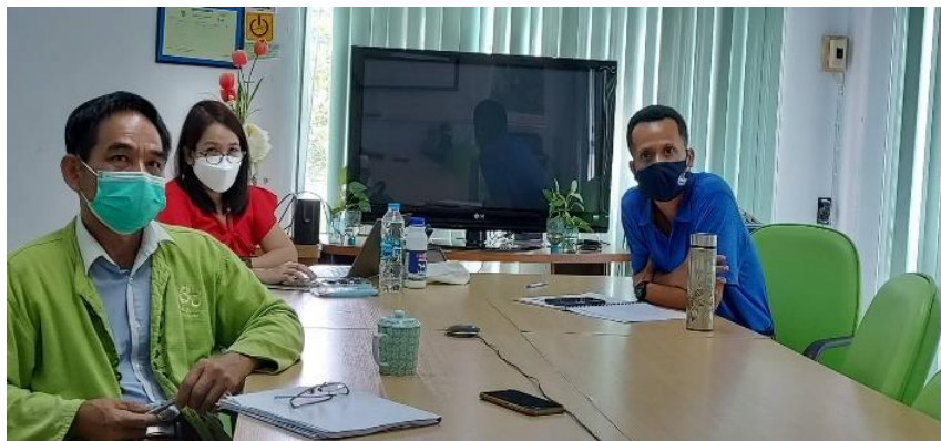
การสัมภาษณ์ผู้บริหารมหาวิทยาลัยแม่โจ้ - ชุมพร