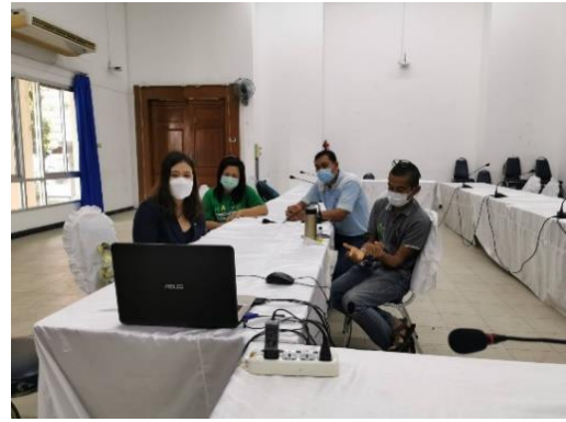
การสัมภาษณ์บุคลากรสายวิชาการ