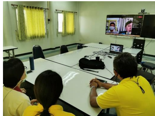
การสัมภาษณ์บุคลากรสายสนับสนุนวิชาการ