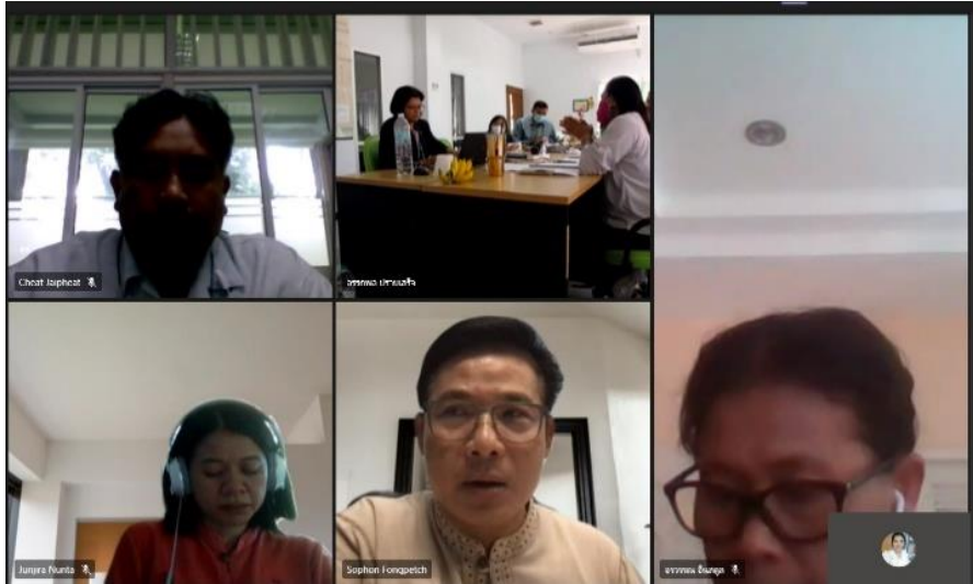
สัมภาษณ์อาจารย์ในหลักสูตร