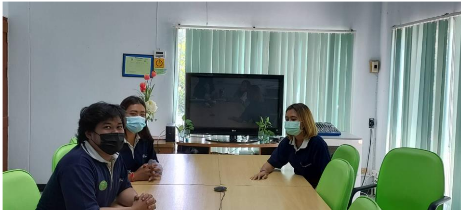
สัมภาษณ์นักศึกษา