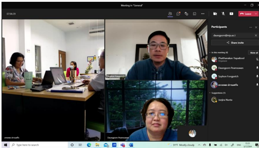
การสรุปผลการตรวจประเมิน