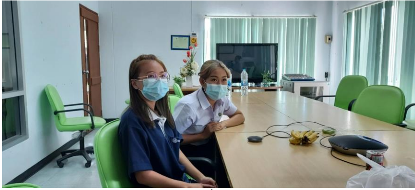
สัมภาษณ์นักศึกษา