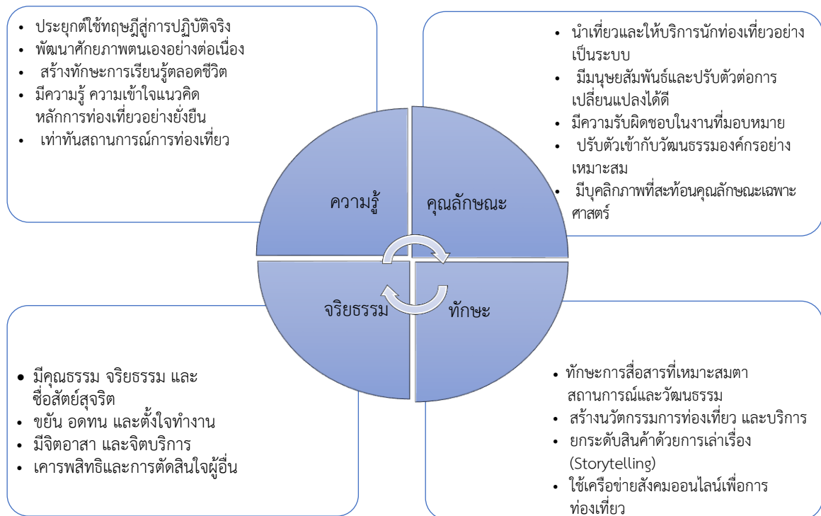
ภาพที่ 2 กลไกการพัฒนาหลักสูตรศิลปศาสตรบัณฑิต สาขาวิชาการท่องเที่ยวและบริการ

(Global Sustainable Tourism Criteria หรือ GSTC) ของสภาการท่องเที่ยวอย่างยั่งยืนโลก เป้าหมายการพัฒนาที่ยั่งยืน (SDG) การพัฒนาเศรษฐกิจแบบบีซีจี โมเดล (BCG Model) และแผนพัฒนาการศึกษา มหาวิทยาลัยแม่โจ้ฉบับที่ 13 (พ.ศ.2565-2569) และวิสัยทัศน์คณะที่มุ่งสู่ความเป็นเมืองแห่งสุขภาวะ (Well Being) โดยบูรณาการศาสตร์ต่างๆ ที่เกี่ยวข้องมาปรับใช้ตรงตามความต้องการของตลาดแรงงานในอุตสาหกรรมท่องเที่ยว มีจรรยาบรรณตามหลักวิชาการ/วิชาชีพ รองรับนโยบายของรัฐและความต้องการของอุตสาหกรรมท่องเที่ยวและการเปลี่ยนแปลง